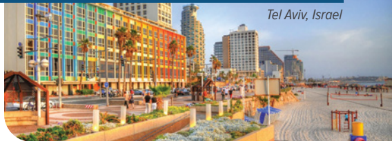
Tel Aviv, Israel

AVIV tem, em seu contexto bíblico, quatro significados principais. O primeiro tem o sentido de “espiga verde”, que está relacionado à cevada ainda fresca ou no ponto certo de colheita. Você pode